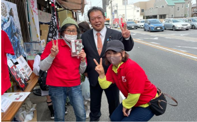
◆ご縁日 毘沙門天 妙福寺(4/3)