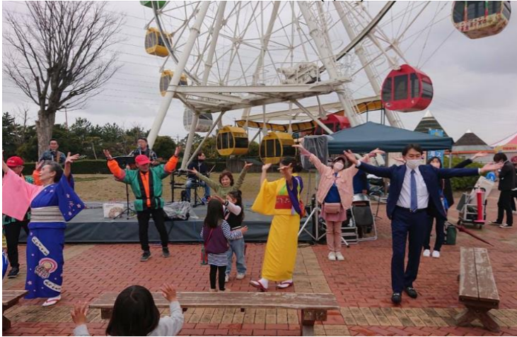
◆アースデイ 碧海油ヶ淵 PRステージ 明石公園 (3/12)