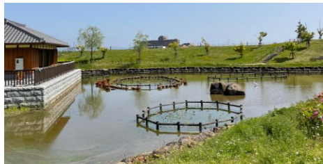
県営油ヶ淵公園 ハス池などがある水生花園