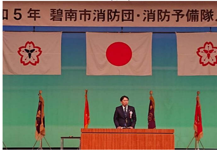
◆碧南市消防団・消防予備隊入隊式 (3/26)