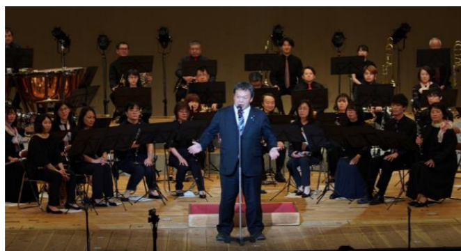
◆定期演奏会 碧南市民吹奏楽団 (4/23)